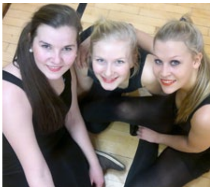
nesset-nominert: Black Pearls.