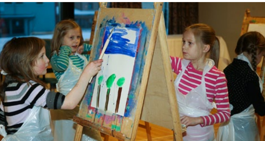
mye visuelt: Elevene innen visuell kunst deltok både med utstilling og verkstedkurs.

Budsjettet på 30.000 kroner gikk i sin helhet til trykking av program, annonsering og distribusjon. Elevene fra visuelle kunstoffag stod for illustrasjonen av programmet, som ble levert til alle husstander i kommunen.