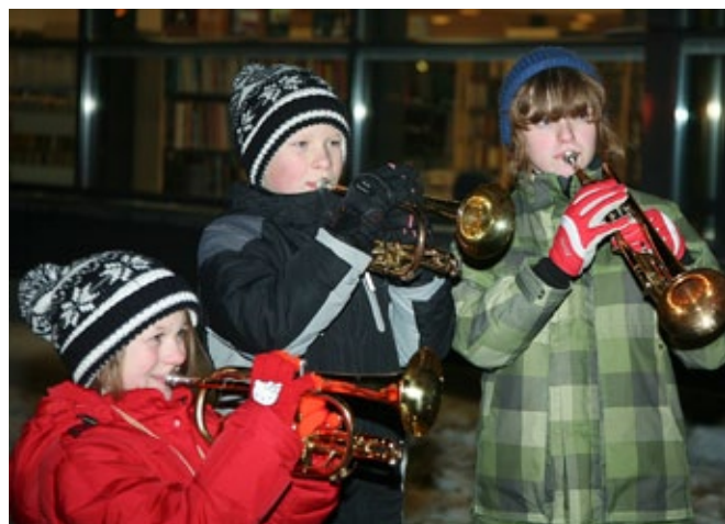
inne og ute: Det ble avviklet konserter både inne og ute.