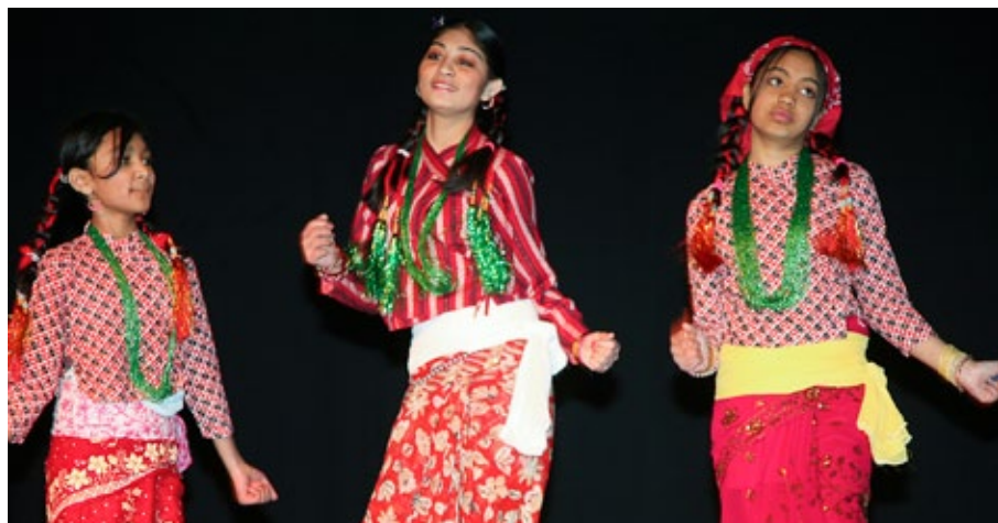
dans også: Internasjonalt snitt over danseoppvisningene fra Vadsø kulturskole.