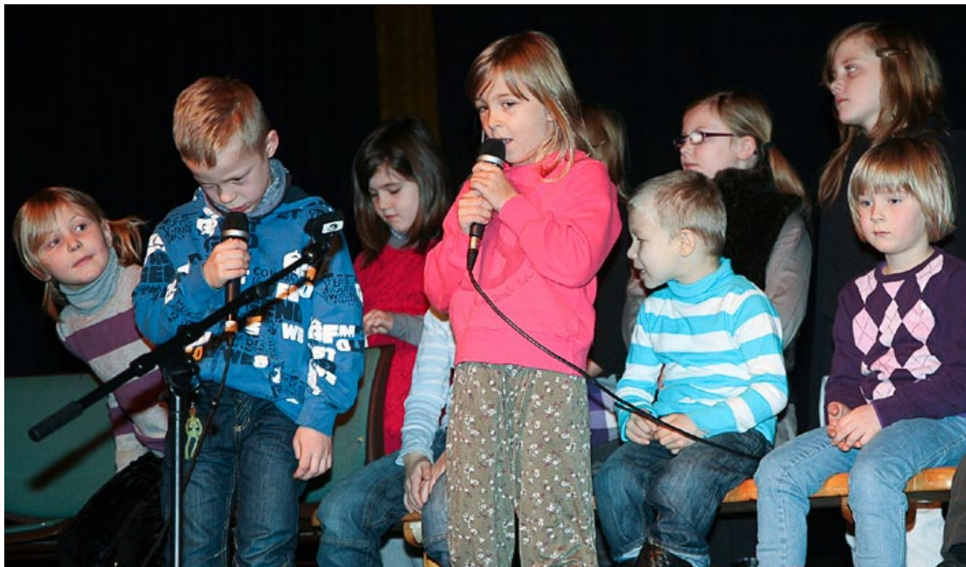
stor innsats: Både små og store ved Vadsø kulturskole gjorde en stor innsats under Kulturdagen.