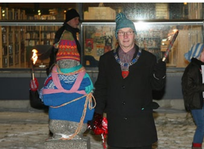
kunststrikk: Kulturskoleelever sørget for ny beklledning til kjente vadsøskulpturer.