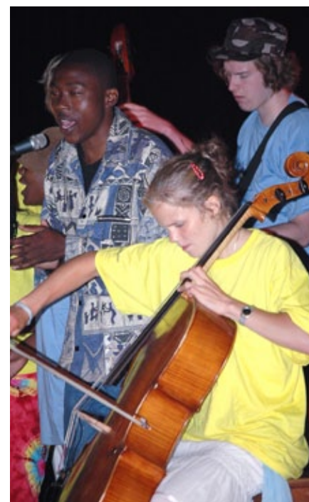
afrikaopplevelser venter: Spennende kulturelle opplevelser i Afrika venter ungdom fra Hordaland.